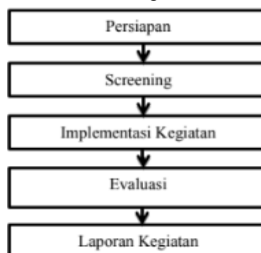
Gambar 1. Diagram Proses Implementasi Kegiatan

Kegiatan Pengabdian Kepada Masyarakat (PKM) ini dilakukan dengan cara membagi sosialisasi tentang. Implementasi Kegiatan dapat diuraikan sebagai berikut :