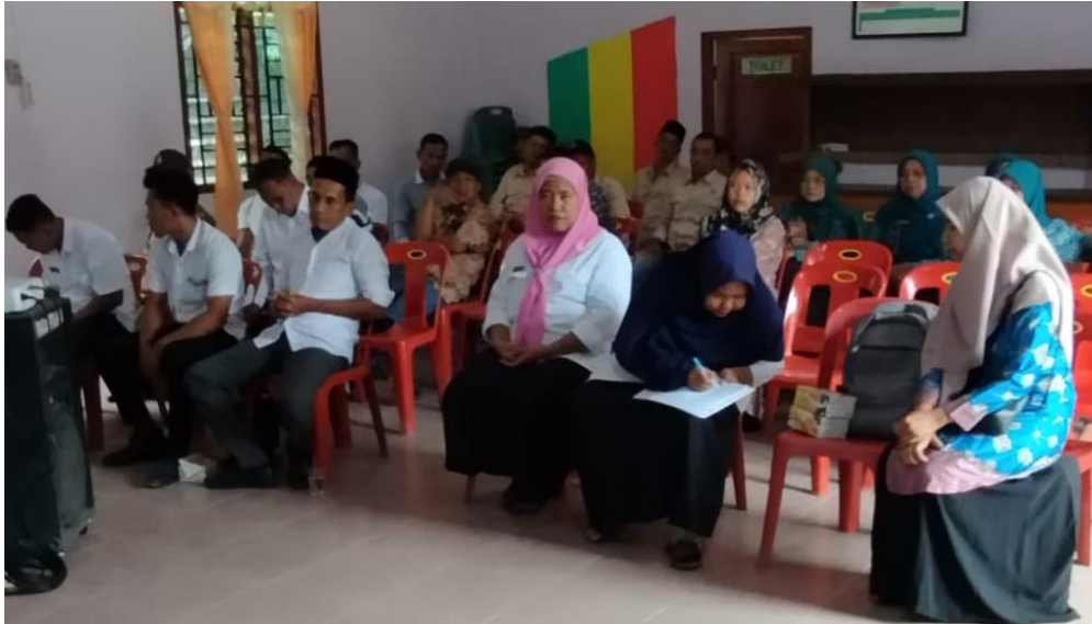
Gambar 3. Proses Diskusi Kelompok