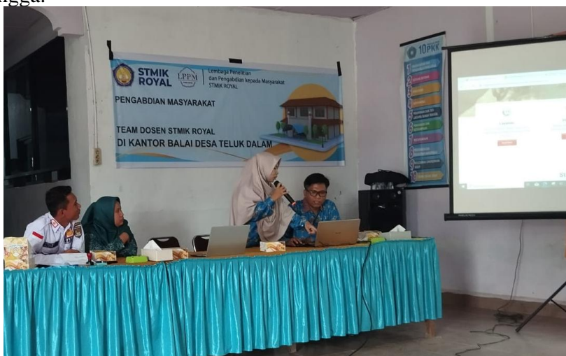
Gambar 2. Pemaparan Materi Pelatihan Dasar Penggunaan Teknologi Digital