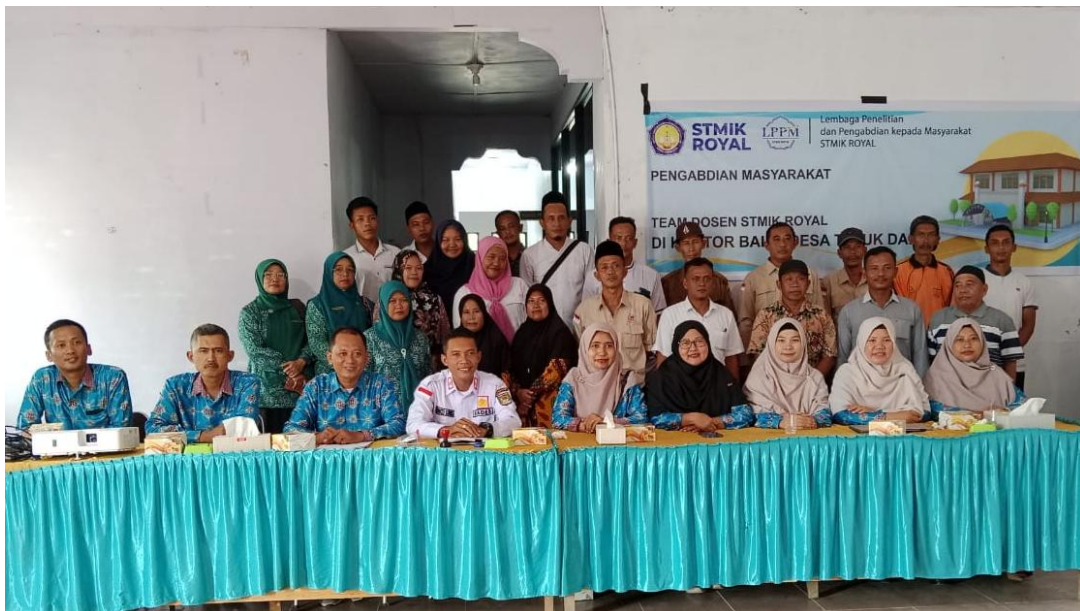
Gambar 4. Foto Bersama Tim PkM dan Peserta

Dengan rincian kegiatan di atas, program ini diharapkan tidak hanya meningkatkan kapabilitas digital masyarakat Desa Teluk Dalam tetapi juga memberikan dampak jangka panjang bagi pertumbuhan ekonomi dan kemandirian desa.