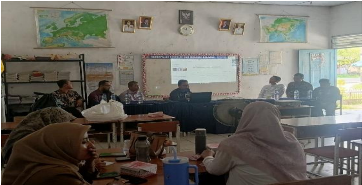
Gambar 2. Kegiatan Pelatihan sesi 1

Gambar 2 menunjukkan kegiatan pelatihan sesi pertama yang dilaksanakan bersama guru di SD Negeri 15 Padang Genting. Pada tahap ini, tim pengabdian memberikan pemahaman mengenai konsep dasar Project-Based Learning terkait dalam penyusunan modul dan RPP [16]. Kegiatan pelatihan dilanjutkan pada sesi kedua sebagaimana ditunjukkan pada Gambar 3. Pada tahap ini, guru mulai mempraktikkan penyusunan aktivitas pembelajaran berbasis proyek dalam penyusunan modul dan RPP yang disesuaikan dengan materi Bahasa Inggris di sekolah dasar.