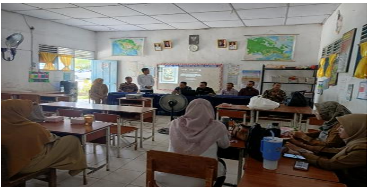
Gambar 3. Kegiatan Pelatihan sesi 2

Tim pengabdian memberikan pendampingan secara langsung dalam merancang langkah pembelajaran, menentukan tema proyek, serta menyusun evaluasi pembelajaran yang sesuai dengan karakteristik siswa. Pendampingan ini dilakukan secara kolaboratif dan aplikatif agar guru tidak hanya memahami konsep Project-Based Learning (PBL) secara teoritis, tetapi juga mampu mengimplementasikannya secara efektif dalam proses pembelajaran di kelas sehingga dapat meningkatkan keterlibatan dan keterampilan komunikasi siswa dalam pembelajaran Bahasa Inggris.