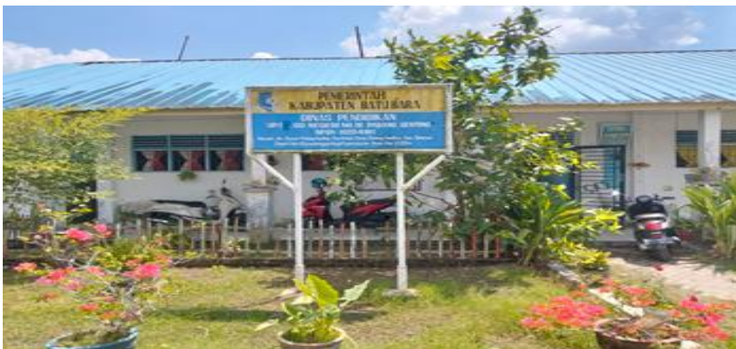
Gambar 1. Lokasi PKM SDN 15 Padang Genting

Oleh karena itu, kegiatan pengabdian kepada masyarakat ini dilaksanakan dengan judul “Pengembangan Model Pendampingan Berbasis Project-Based Learning untuk Meningkatkan Kualitas Pembelajaran Bahasa Inggris di SDN 15 Padang Genting.” Kegiatan ini bertujuan meningkatkan kompetensi guru dalam menyusun dan menerapkan pembelajaran berbasis proyek sehingga kualitas pembelajaran Bahasa Inggris di sekolah dasar dapat meningkat.