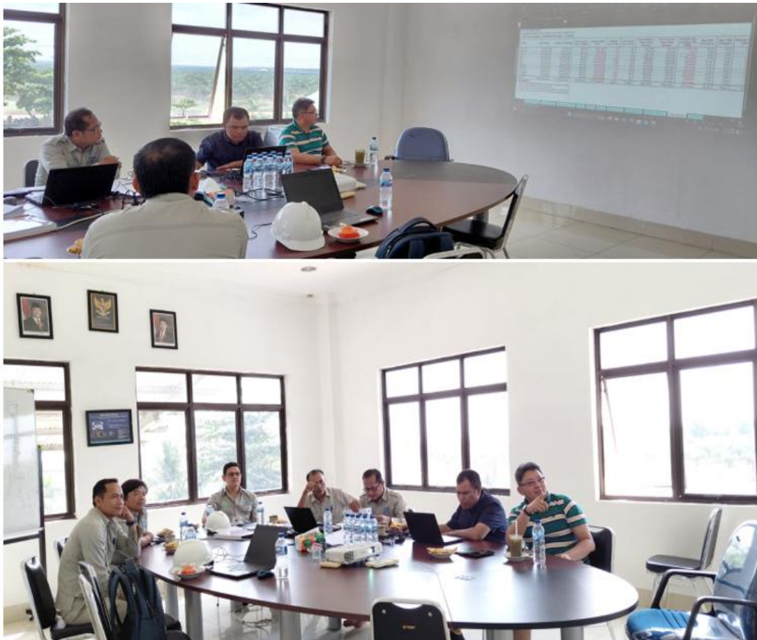
Gambar 2. Penyampaian Materi CSA Report kepada Peserta

Berdasarkan pengamatan selama pelaksanaan kegiatan, peserta menunjukkan tingkat partisipasi yang cukup tinggi. Hal tersebut terlihat dari banyaknya pertanyaan dan diskusi yang muncul terkait berbagai permasalahan operasional yang selama ini sering menjadi objek temuan audit internal. Tingginya antusiasme peserta menunjukkan bahwa kebutuhan terhadap pemahaman mengenai pengendalian internal dan pengelolaan risiko masih cukup besar, khususnya bagi unit kerja yang berhubungan langsung dengan aktivitas administrasi, pengelolaan aset, serta pengendalian persediaan. Selain memperoleh pemahaman mengenai konsep pengendalian internal, peserta juga mendapatkan gambaran mengenai pentingnya keterlibatan seluruh unit kerja dalam proses pengawasan. Selama ini sebagian peserta masih memandang bahwa pengendalian internal merupakan tanggung jawab auditor internal semata. Namun melalui kegiatan pelatihan, peserta mulai memahami bahwa efektivitas pengendalian sangat dipengaruhi oleh kesadaran setiap individu dalam menjalankan prosedur kerja yang telah ditetapkan perusahaan.